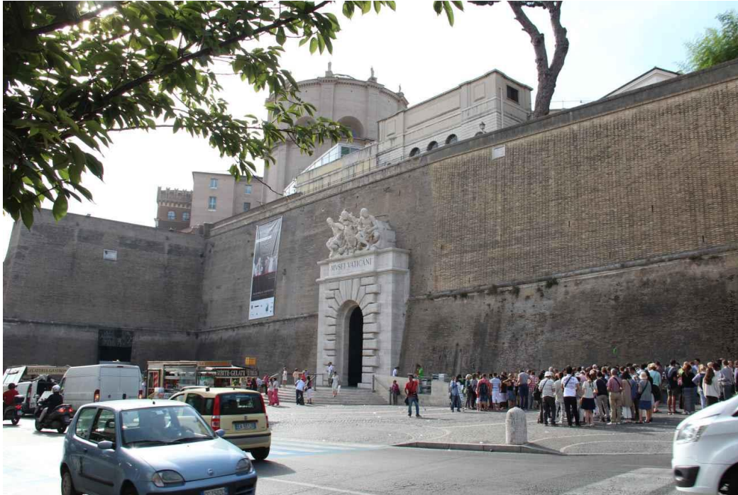
Vatikánská Musea - vstup