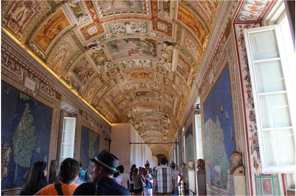
Gallerie delle Carte Geografiche