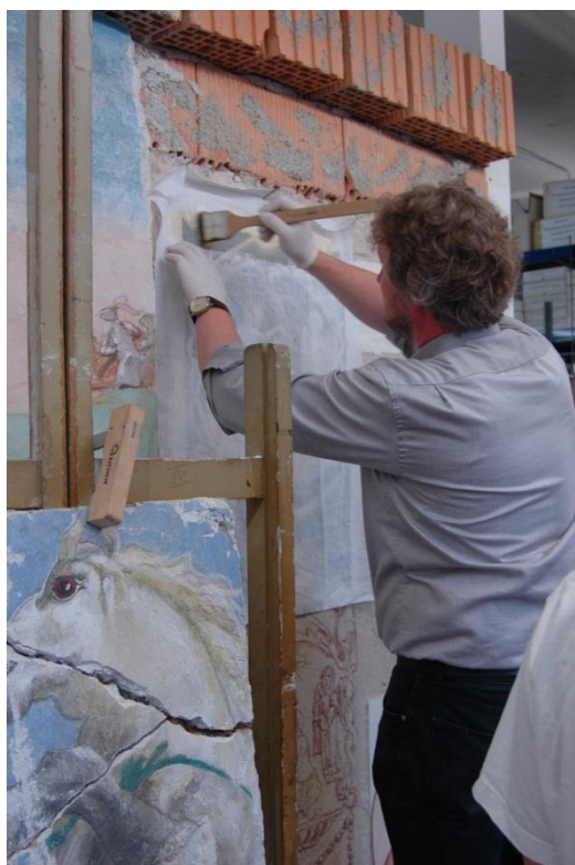
Obr. č. 2.: Kurz strappa a stacca