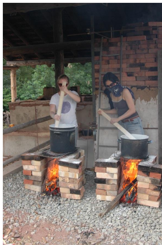
Obr. č. 3.: Kurz výroby sádry