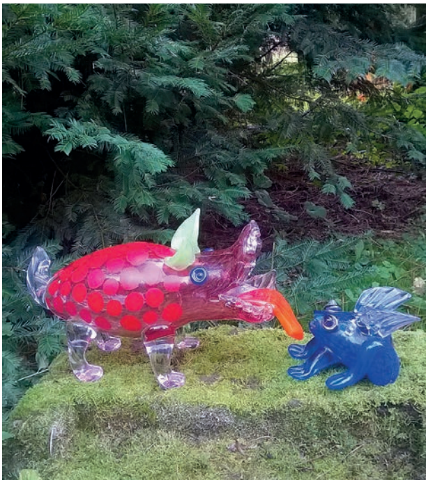
Na zahradě , hutně tvarované sklo, 23 x 44 x 12 cm, 13 x 20 x 16 cm In The Garden, hot shaped glass