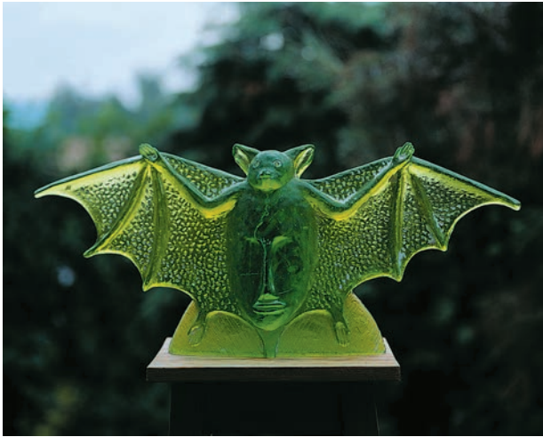
Nepokojný spáč , uranové sklo tavené ve formě, 33 x 74 x 9 cm Restless Sleeper, mold cast uranian glass