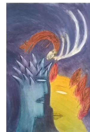
Big Smile , colour intaglio graphic, 49 x 36 cm