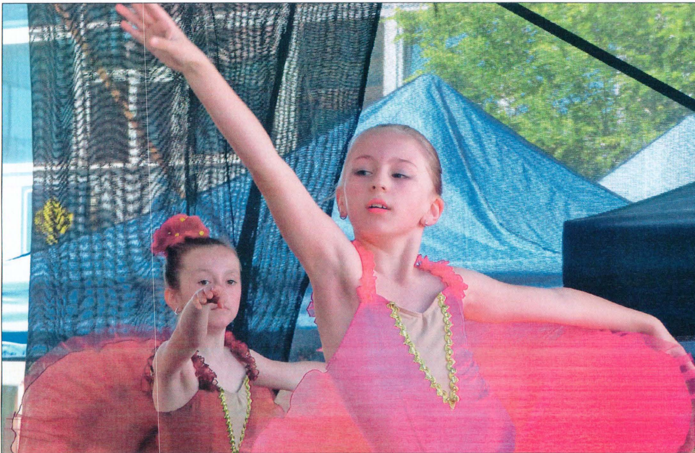
Mladé baletky sklízejí na třídě Míru tradičně aplaus.

dlo umění oblíbené vypouštění balónek na Pernštýnském náměstí. Tomuto okamžiku tradičně přihlížejí stovky dychtivých