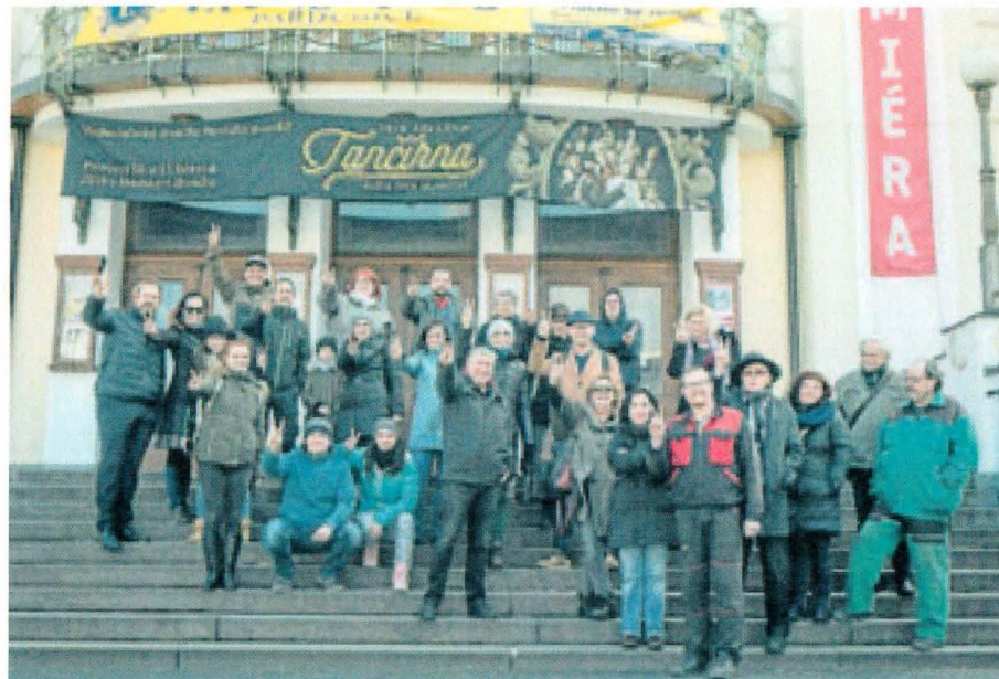
KAKCI se připojilo také Východočeské divadlo.