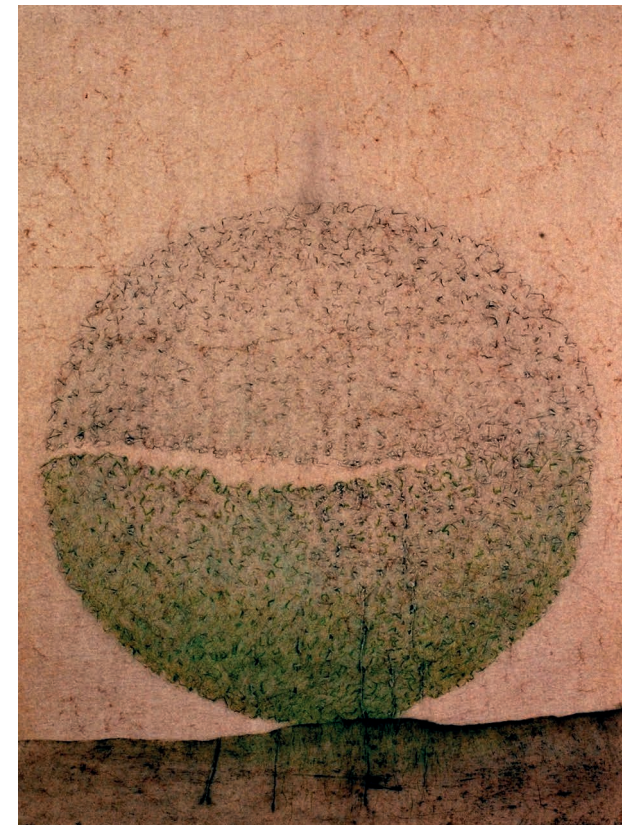
Křehký plod, 2000

Sedmdesátá, osmdesátá a také devadesátá léta minulého století jsem se věnovala hlubotisku – leptu se suchou jehlou. Pracovala jsem s koncentrovanou kyselinou solnou, kterou jsem před jinými kyselinami preferovala pro její dravost. V zinkové plotně zanechávala hluboce vyleptaný reliéf. Po roce 2000 jsem však ztratila možnost leptat ve volném prostoru u svého ateliéru a tak jsem byla nucena hledat jinou techniku, která lept nahradí. Našla jsem si tzv. kombinovaný slepotisk, který mi umožňoval dále pracovat se strukturou a tvary, i s větším formátem. Sice se vytratila robustnost barvy, štavnatost vyleptané plochy i linky, ale nahradily ji jemné valéry v kom-