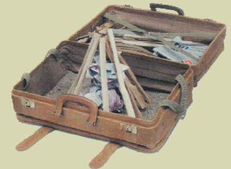
Přenosné ohniště pro managery – Ondřej Grüber