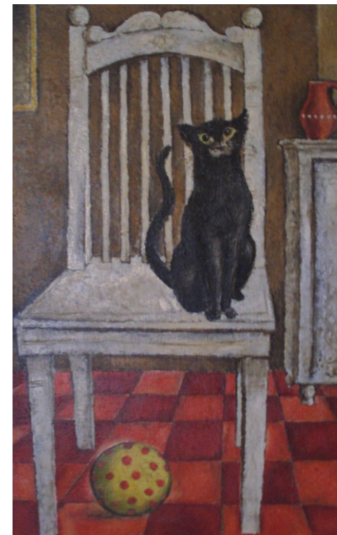
Doma u maminky, olej 75 x 60 cm, 1980

Zdeněk Sejček je evidován jako výtvarný umělec – akademický malíř. Je členem Sdružení českých výtvarných teoretiků a kritiků v Praze.