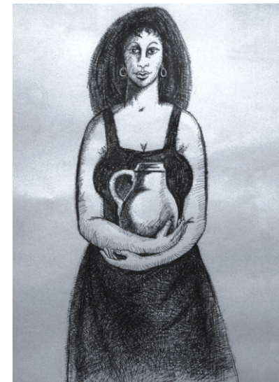
Džbán, kresba tuší, 43x31 cm, 1995