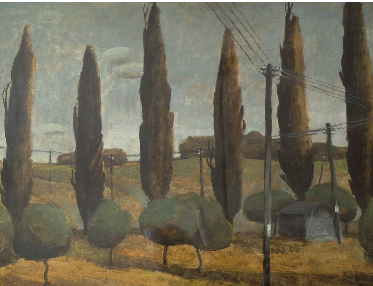
Krajina s topoly, olej, 60 x 85 cm, 1985