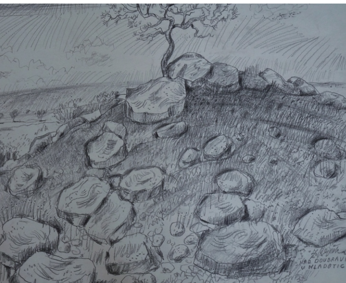
Motiv z Vysočiny, kresba tužkou, 2008