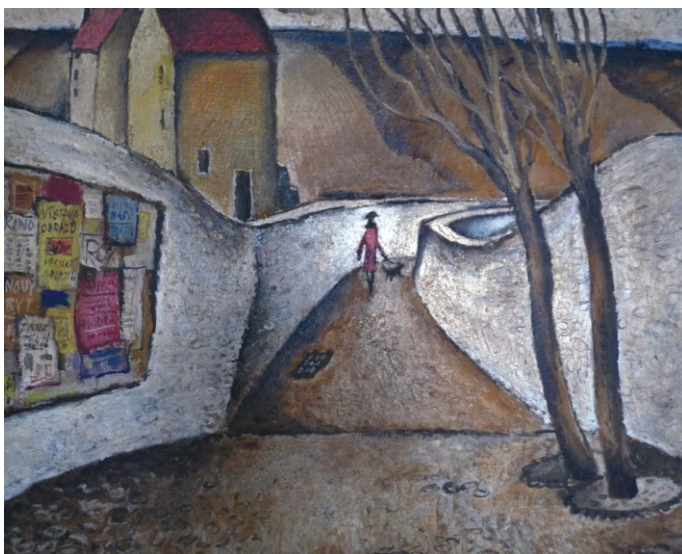
Na konci města, olej 70 x 90 cm, 1990