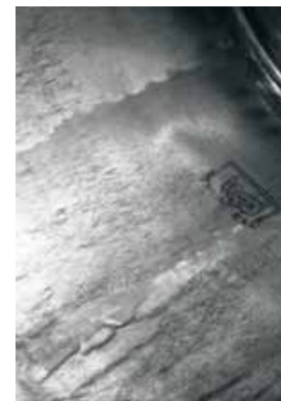
Zátiší z barevny

v Olomouci, která je monotematická a rozvíjí téma zátiší. Následují tři výstavy v zahraničí, kde se znovu vrací k tematice z let 1968 – 1974. Výstava v Olomouci v roce 1987, kde doplňuje téma zátiší, se stává na delší dobu jeho poslední výtvarnou výstavou.