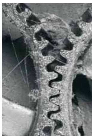
Zátiší z kalandru

skou krajinu pro další výstavu. Pak přestává obesílat amatérské soutěže a při zaměstnání začíná externě studovat FAMU - obor umělecké fotografie u profesora Jána Šmoka. Opouští Slovensko a fotografii lidí a pro potřeby FAMU tvoří první komponované fotografie neživých věcí, klade důraz na výtvarnou stránku, kompozici a světlo a nazývá je zátišími. Zpočátku jsou zátiší černobílá, později je oživuje kolorováním. V roce 1975 odchází do Prahy, kde pokračuje ve studiu FAMU jako řádný posluchač. V roce 1977 se žení, zakládá rodinu a stěhuje se zpět do Svitav. Po absolutoriu na FAMU v roce 1978 začíná pracovat jako svobodný výtvarník. Práci nachází převážně na Moravě. Fotografuje propagační barevné snímky, firemní katalogy v oblasti průmyslu, architektury a gastronomie, dělá velkoplošné interiérové fotografie a přitom připraví velkou retrospektivní výstavu ve Svitavách. Na ni navazuje další výstava