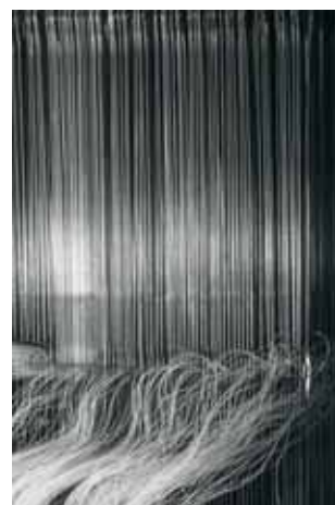
Zátiší z tkalcovny

skou krajinu pro další výstavu. Pak přestává obesílat amatérské soutěže a při zaměstnání začíná externě studovat FAMU - obor umělecké fotografie u profesora Jána Šmoka. Opouští Slovensko a fotografii lidí a pro potřeby FAMU tvoří první komponované fotografie neživých věcí, klade důraz na výtvarnou stránku, kompozici a světlo a nazývá je zátišími. Zpočátku jsou zátiší černobílá, později je oživuje kolorováním. V roce 1975 odchází do Prahy, kde pokračuje ve studiu FAMU jako řádný posluchač. V roce 1977 se žení, zakládá rodinu a stěhuje se zpět do Svitav. Po absolutoriu na FAMU v roce 1978 začíná pracovat jako svobodný výtvarník. Práci nachází převážně na Moravě. Fotografuje propagační barevné snímky, firemní katalogy v oblasti průmyslu, architektury a gastronomie, dělá velkoplošné interiérové fotografie a přitom připraví velkou retrospektivní výstavu ve Svitavách. Na ni navazuje další výstava