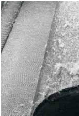
Zátiší z přádelny