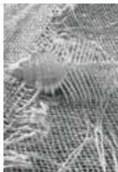
Zátiší z autoportrétu