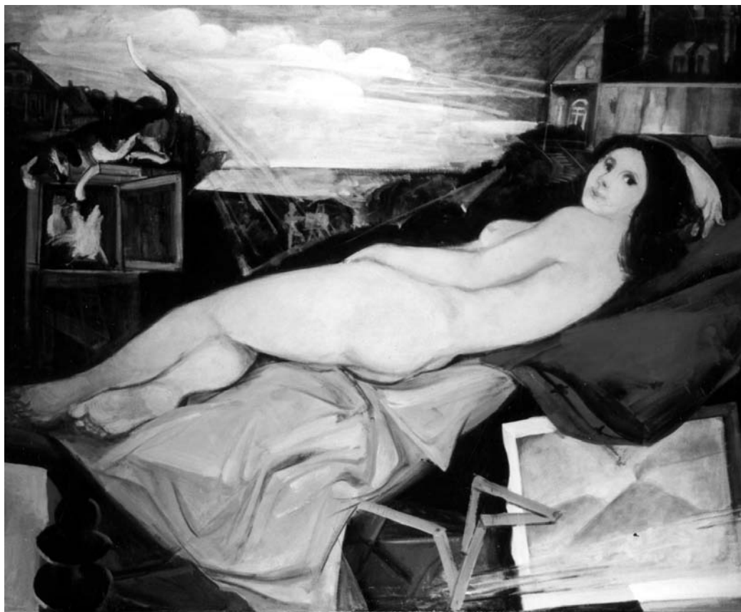
nahoře: Jak spala ... odpust' Giorgione olej na plátně 90 x 110 cm

Když jsem byl ještě malej rozumnej kluk a nevěděl jsem, co jsou to emoce a paradoxy a jiný věci, tak jsem si v drogerii u pana Doudy kupoval malý barvíčky a dlouhý štětečky, místo buřta na polední školní přestávku. Byl jsem štíhlej a třepetal jsem se rozechvěním před pastózní parádou Úprkového divadla v národních krojích a líbily se mi kalendáře z minulýho století, protože v nich byly reklamy na cestování parolodí do Ameriky a ilustrace různých Věnceslavů. Mezitím jsem měl rád malý blbý psíky a koňský