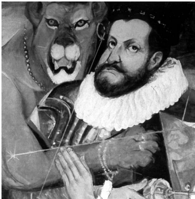
Rudolf II olej na plátně (detail) 115 x 90 cm

Jiří Ščerbakov se narodil 12. 12. 1926 v Hradci Králové - Třebšiši