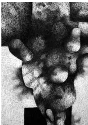
Symbióza ve třech, 2004 kombinovaná technika, 105 x 75 cm