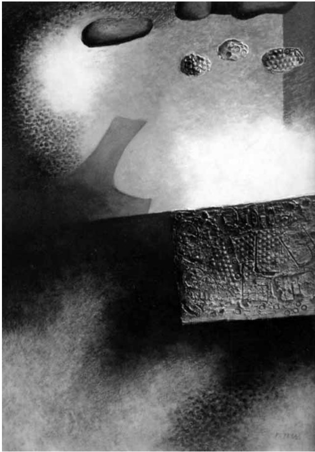
Na titulní straně: Opuštěnost, 2003 kombinovaná technika, 84 x 60 cm