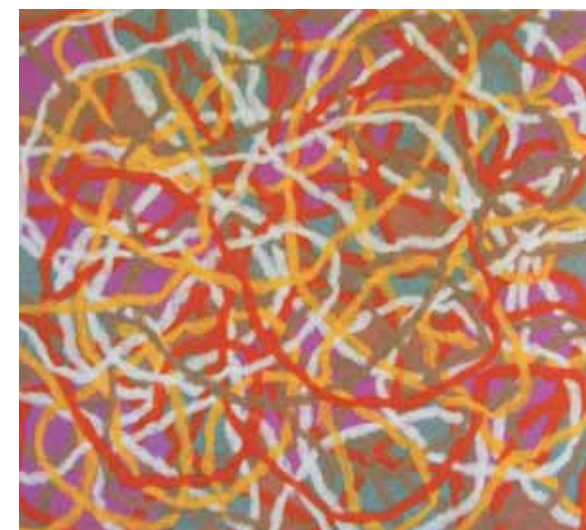
Lineární prostor II. / 2004/plst / 100 x 120 cm

Zuzana Hromadová představuje plstěné krajiny, energetická pole, zajímá se o kolující, eliptickou, vznášející se energii. Objevuje prázdná místa, tunely v prostoru, červí díry vyjádřené barevnými odstíny a materiálem. Její práce zachycují okamžik i věčné trvání, pomíjivost a plynulé mizení i naději návratu. Vypovídá o přírodním dění, cykličnosti, o vodách, řekách, rose i vlhkosti vzduchu. O protikladech, které se doplňují, zvýrazňují i ovlivňují navzájem. O strukturách, které se prolamují v okamžiku nazření, o letních odpolednech, kdy vzduch je takřka hmatatelně nehnutý i o soumracích, které proměňují světlo v tmu, hmotu ve zdání, realitu v neskutečno. I tehdy vzniká svého druhu ornament, sváteční událost v životě člověka.