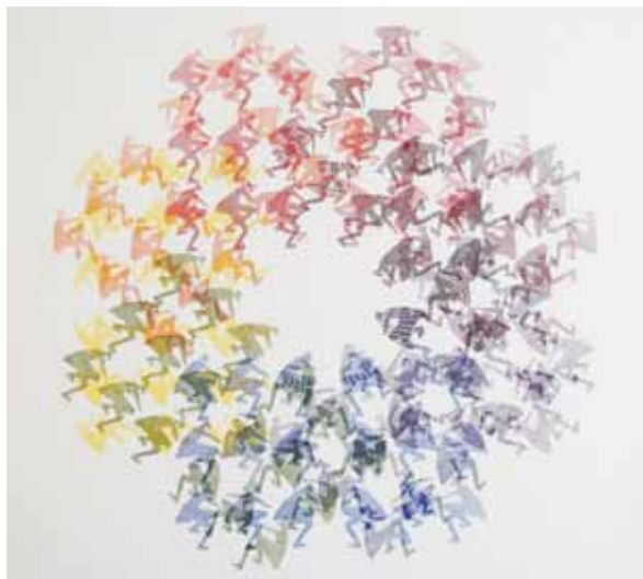
Společensví I. / 2004 / film tisk / 100 x 100 cm