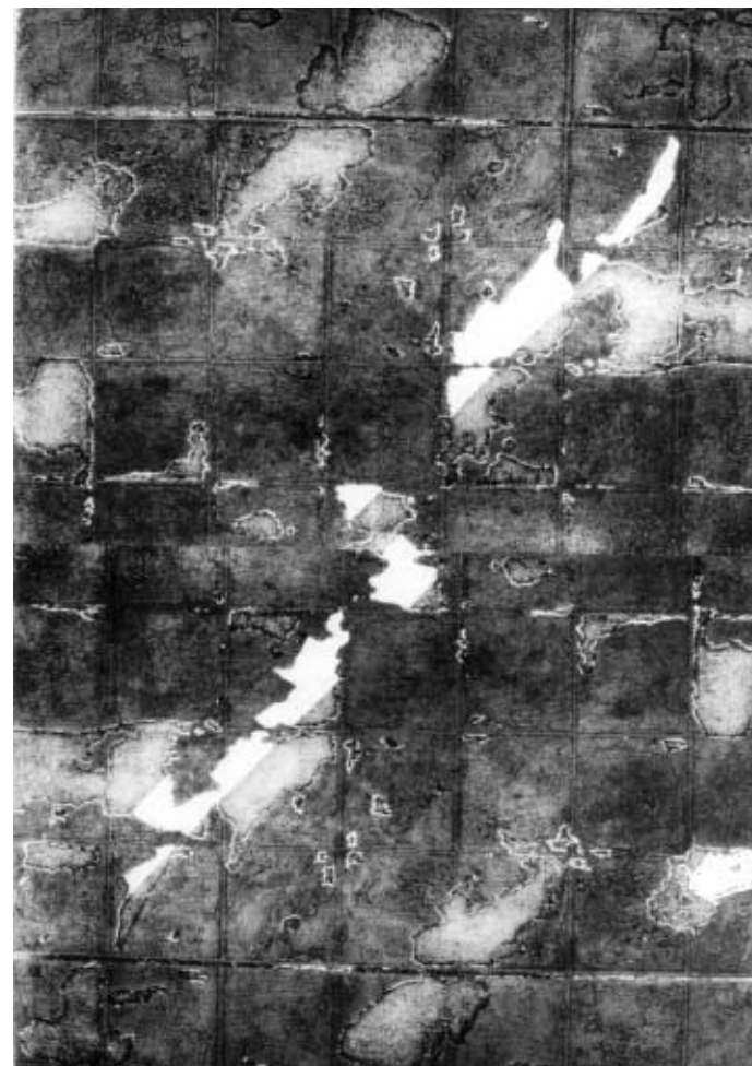
ZATARASENÁ CESTA, hlubotisk, 96 x 64 cm, JINÉ MÍSTO, hlubotisk, 95,5 x 65,5 cm (titulní strana)

V kolekci vystavených prací Evy Francové nacházíme zajímavý příspěvek ke snahám po nalezení, samozřejmě že nikdy ne definitivní, odpovědi na věčné tázání po smyslu a cíli lidské cesty, na odvěkou a zásadní civilizační existenciální otázku „Odkud přicházíme, kdo jsme a kam jdeme?“