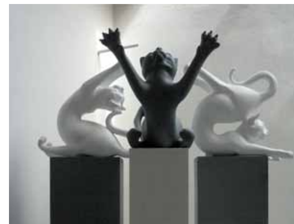
Homage a ExcaLibor K