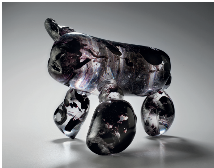
Titulní strana: V pohybu - tavenné sklo (2014) 49 x 16 x 46 cm