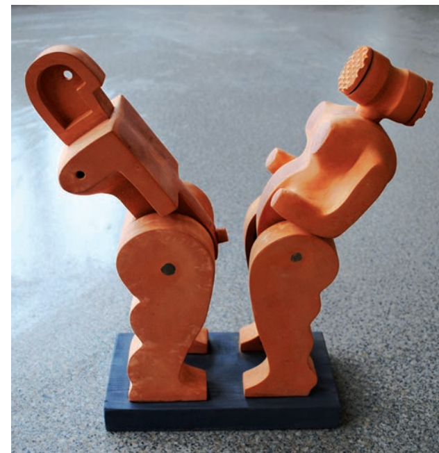
Vzájemná odpudivost, pálená hlína, 38 cm, 2010