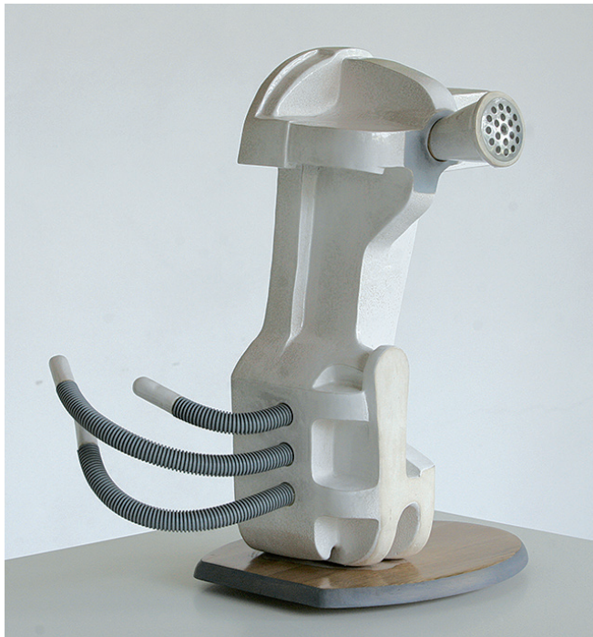
Pradlena, kombinovaná technika, 60 cm, 2001