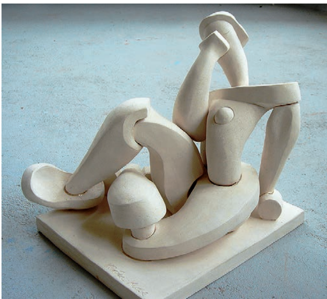
Plačící, pálená hlína, 50 cm, 2007