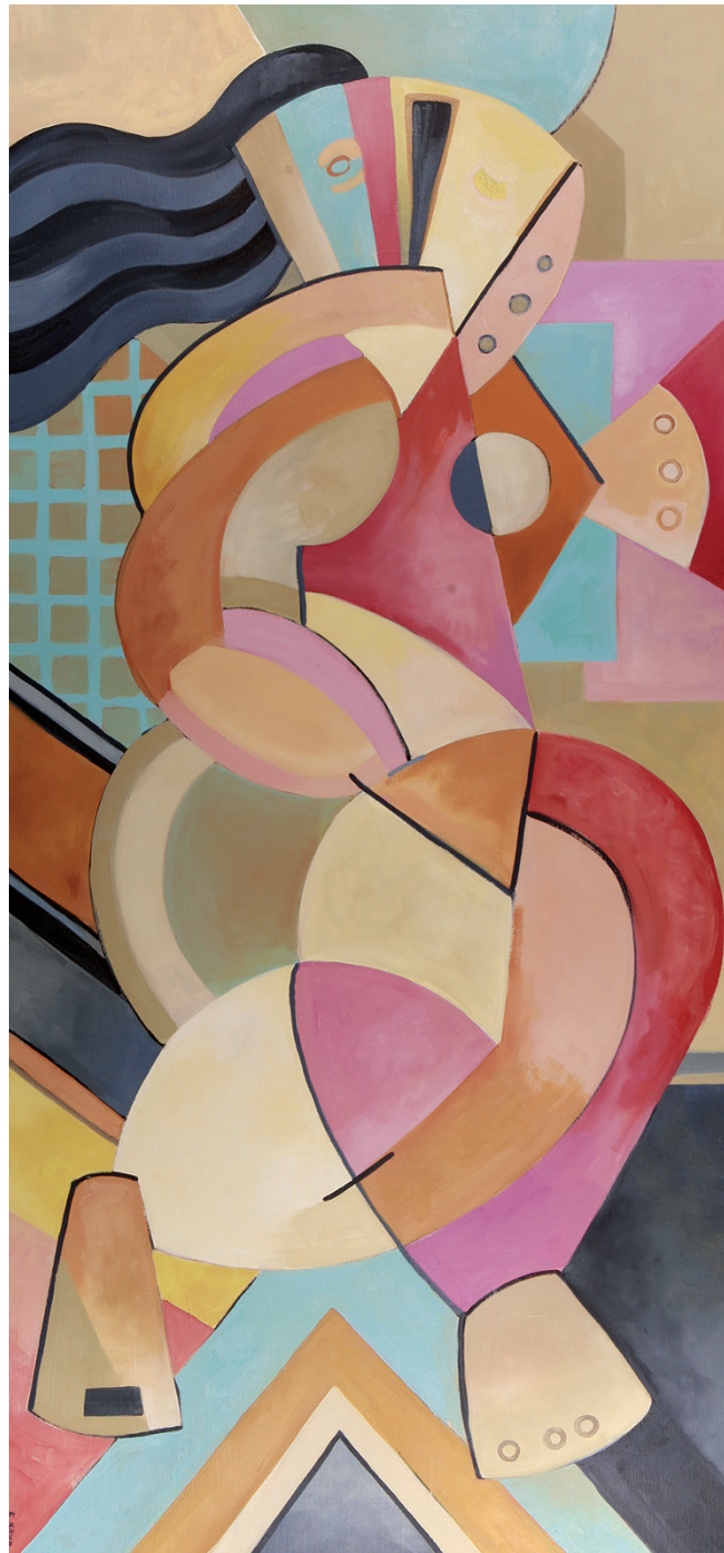
Anděl, olej na plátně, 110 x 200 cm, 2010