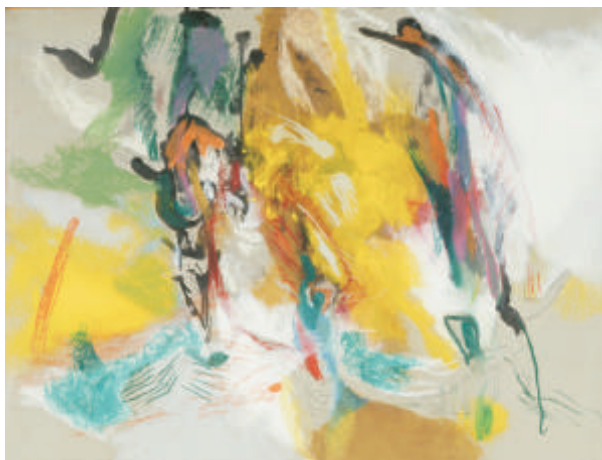
Kvaš, 48x63, 1991 ▲