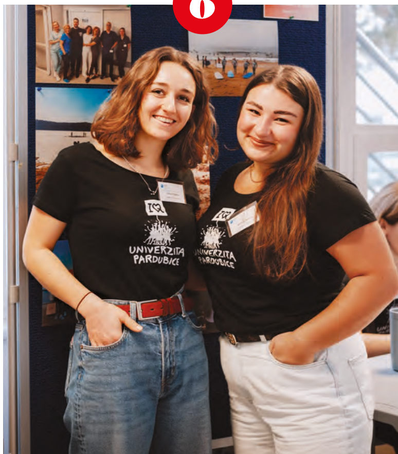
FOTO 6: Amorův šíp se nad kampusem vznášel i další dny. A mířil do světa. A mířil do světa. Svou vysněnou destinaci mohli na Erasmus Day objevit studující i zaměstnaní. Inspirace, kam se vydat na pracovní nebo studijní pobyt, na letní prázdniny nebo rovnou na celý příští semestr, tu bylo víc než dost. A co vy? Už máte svého favorita mezi zeměmi?

FOTO 7: Že láska prochází žaludkem, se ví dávno. Proto letos univerzitní menza servírovala jídla okořeněná láskou. Uhádnete, co ukrýval talíř „Pikantní vzplanutí ve smaragdově rýži“? To jste si pochutnali na kuřecím flamendru s pórkovou rýží. A přidala se i bistra v kampusu. Taková káva plná lásky „nakopla“ všechny tou správnou energií.