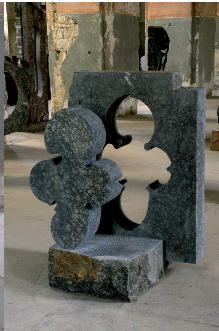
Pozitiv, negativ, 2008 diorit, výška 98 cm

Titulní strana: Strážce, 2006 diorit, výška 131 cm