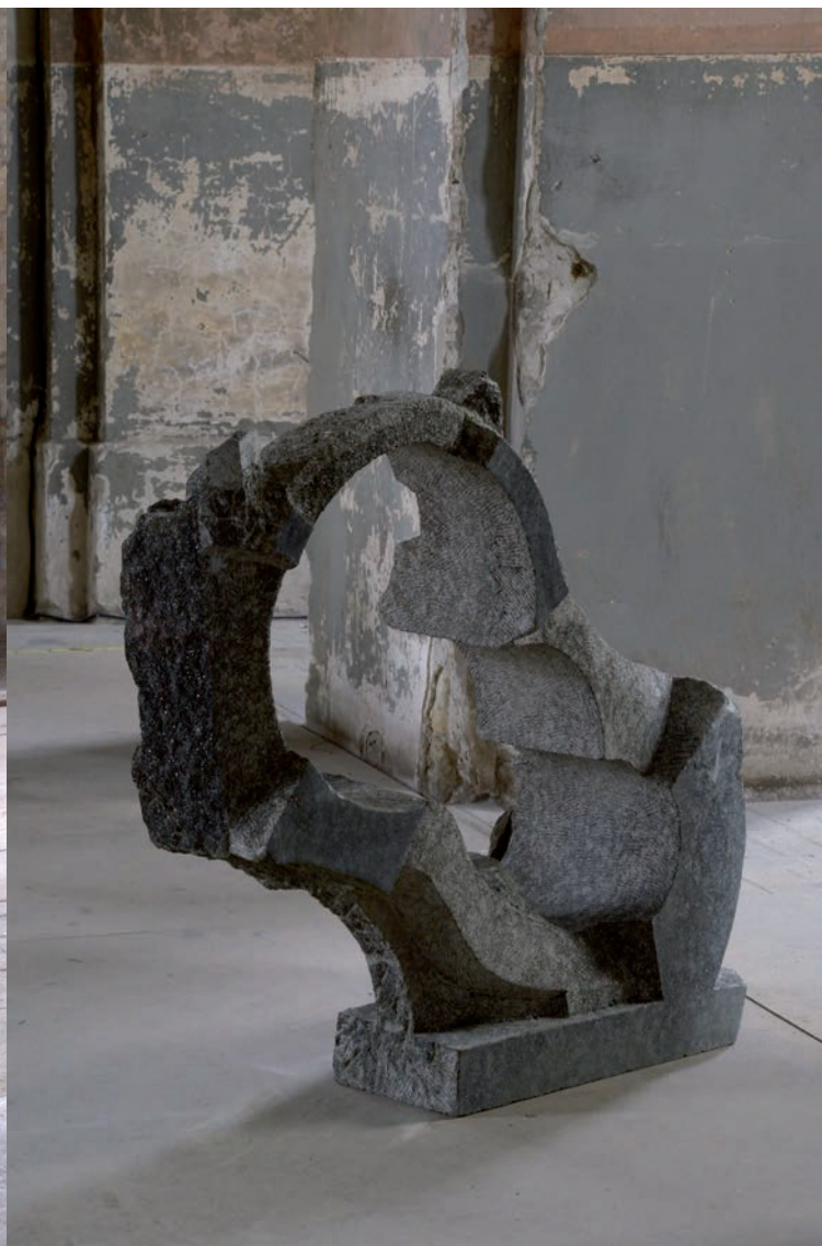
Průhled XI, 2013 diorit, výška 97 cm