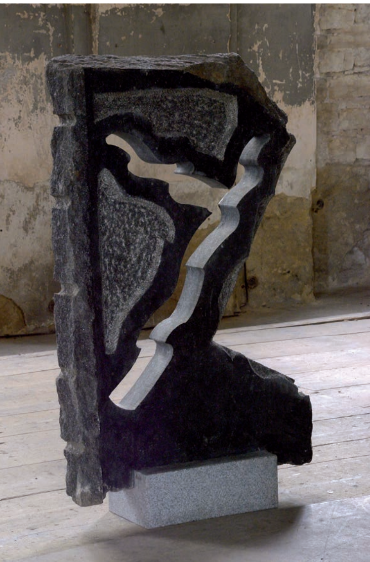
Průhled IV, 2009 diorit a žula, výška 123 cm