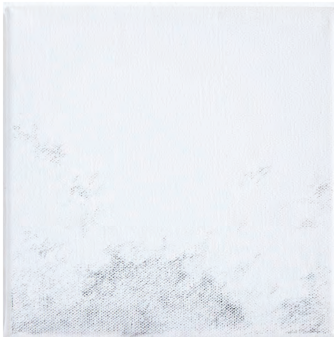
Oblaka, kresba tužkou na plátně, 20 x 20 cm, 2015