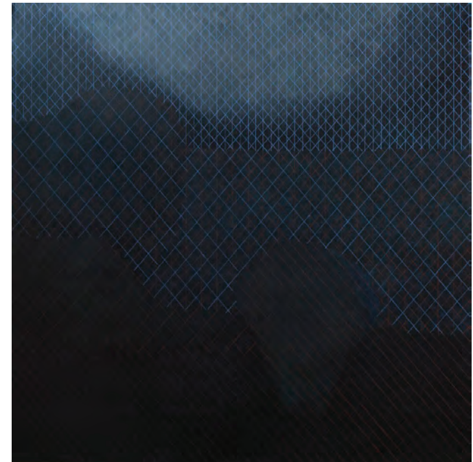
Modrý déšť (Obzor I), olej na plátně, 120 x 120 cm, 2014 / 2015