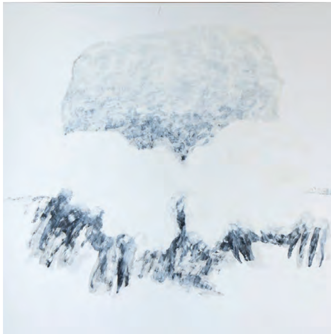
Šedý keř, akryl a olej na plátně, 120 x 120 cm, 2015