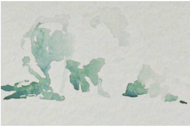
Keře, akvarel na papíře, 10 x 15 cm, 2015