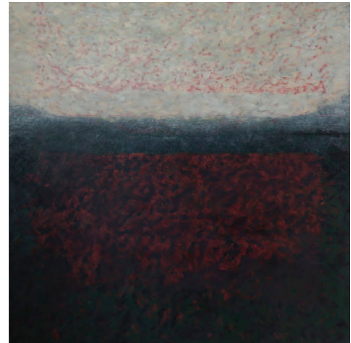
Obzor II, akryl a olej na plátně, 120 x 120 cm, 2014