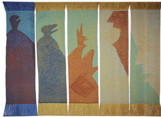
Plky, vazebná tapiserie, V. Vodák