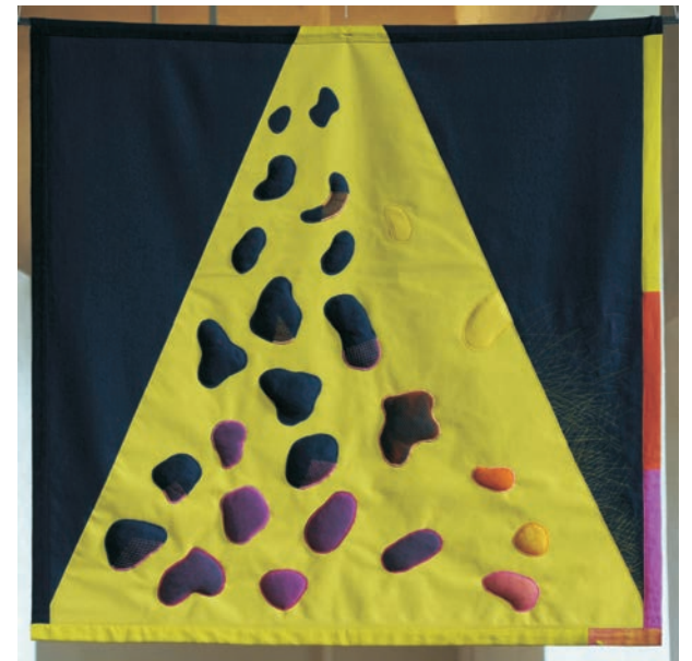
Trpaslíci, šito, R. Vodáková