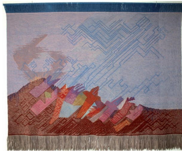
Někteří jen přihlížejí, vazebná tapiserie, V. Vodák