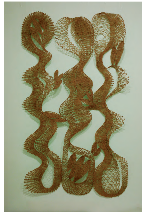
Variace na burské oříšky △ Pole s obilím ▷