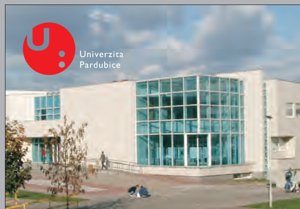
Galerie Univerzity Pardubice Univerzitní knihovna