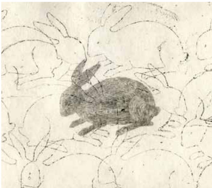
Na Habří autorská kniha, kombinovaná technika, detaily