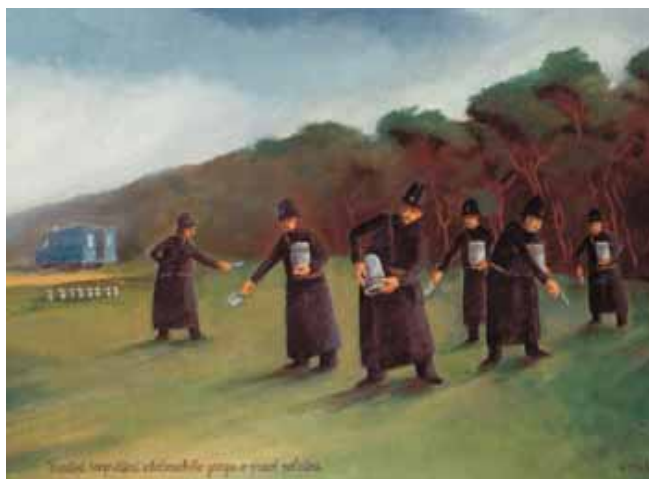
Úspěšné rozprášení zločineckého gangu v právě poledne