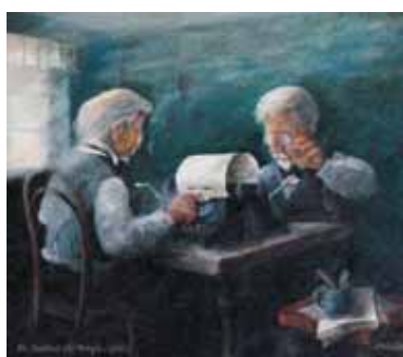
Bři. Mrštíkové píší Maryšu