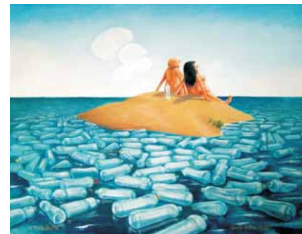
Samá dobrá voda