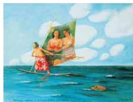
P.Gauguin odplová (ve vši tichosti) z Tahiti na Markézy