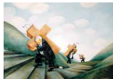
Bez kyslíku a bez pardónu