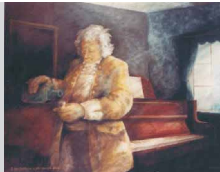
P. Matuška: L. van Beethoven a jeho (dnes již) devátá

Studentská 219, Pardubice - Polabiny otevřeno Po - Čt 8 - 20 hod., Pá 8 - 18 hod. v sobotu 8 - 12 hod., v neděli zavřeno