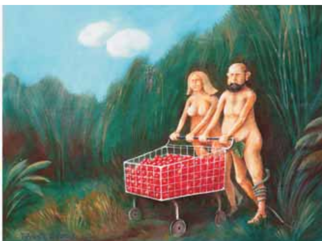
Vyhánění z Hyperráje