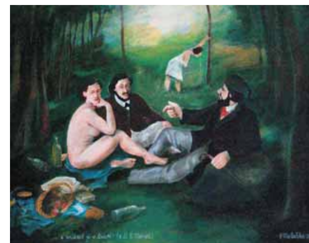
...a snídane je v trávě! (á la E. Manet)