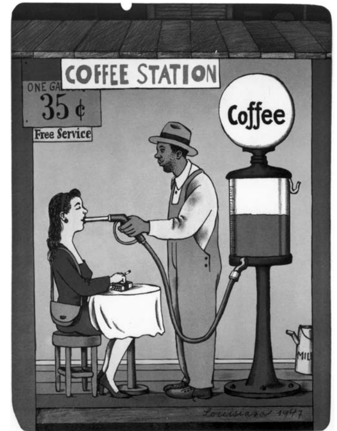
coffee Station barevná litografie