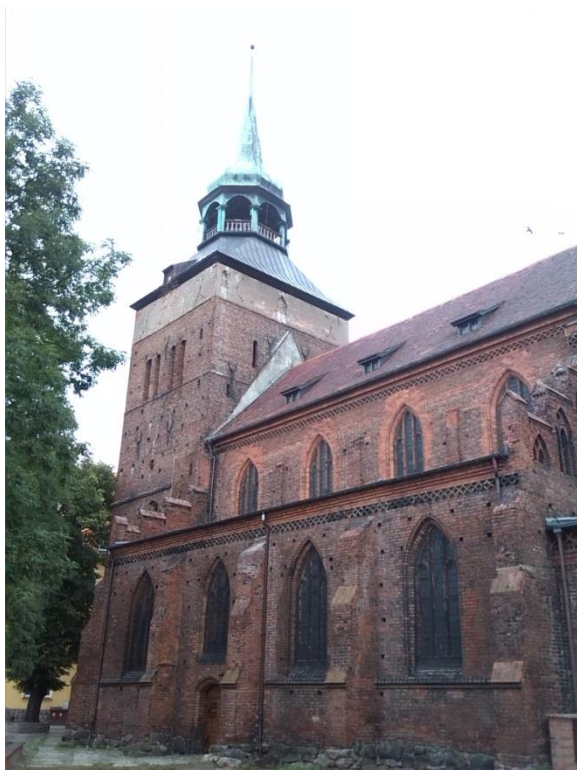
Obrázek 1 Kostel Narození Nejsvětější Panny Marie