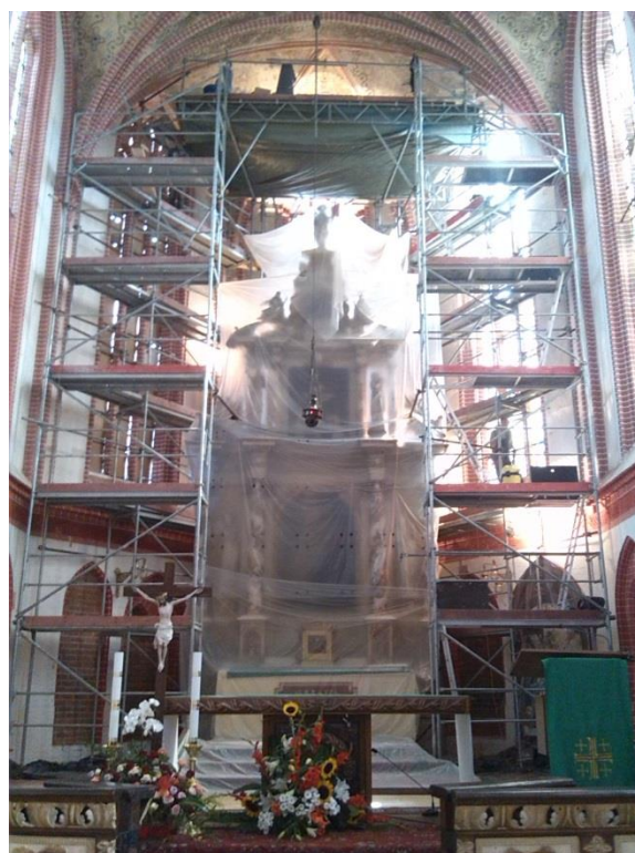
Obrázek 2 Interiér kostela - presbytář s lešením