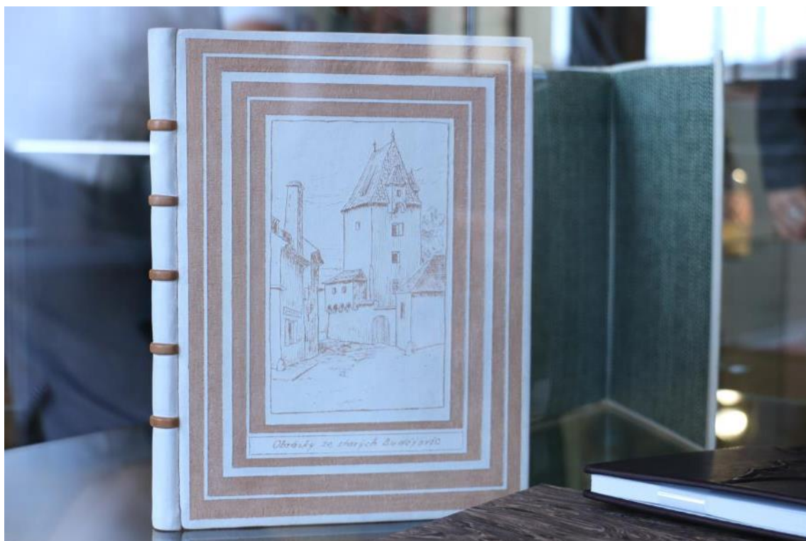
Oceněná knižní vazba Radomíra Slovika.