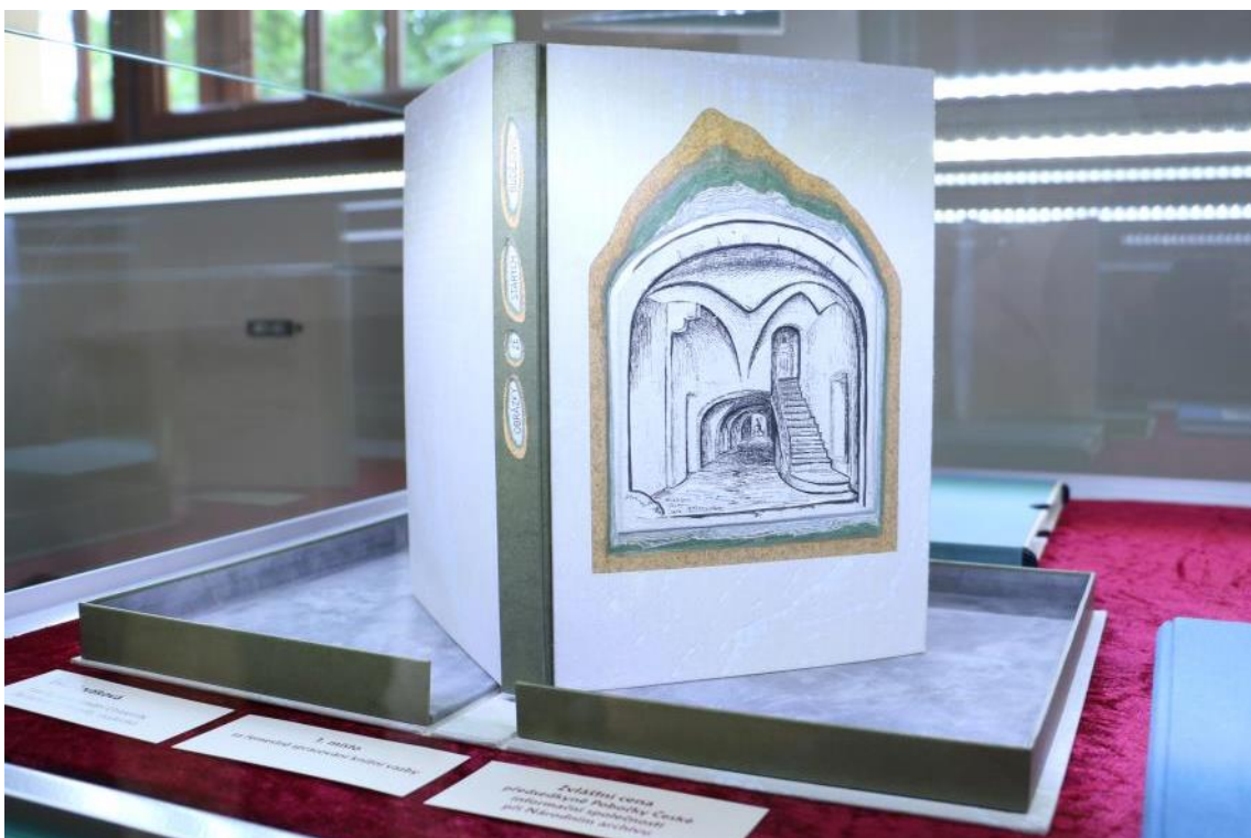
Vítězná knižní vazba Evy Dryákové