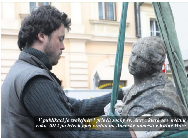
V publikaci je zveřejněn i příběh sochy sv. Anny, která se v květnu roku 2012 po letech opět vrátila na Anenské náměstí v Kutné Hoře