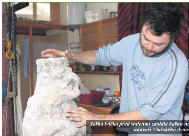
Soška lvička před staletími zdobila kašnu na nádvoří Vlašského dvora